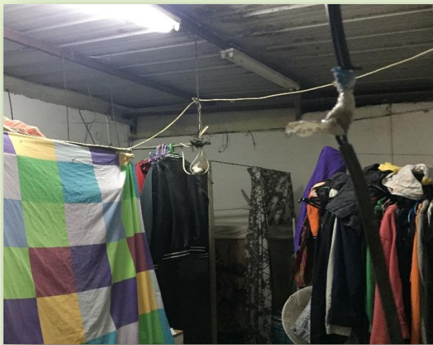
משותפים עם גברים