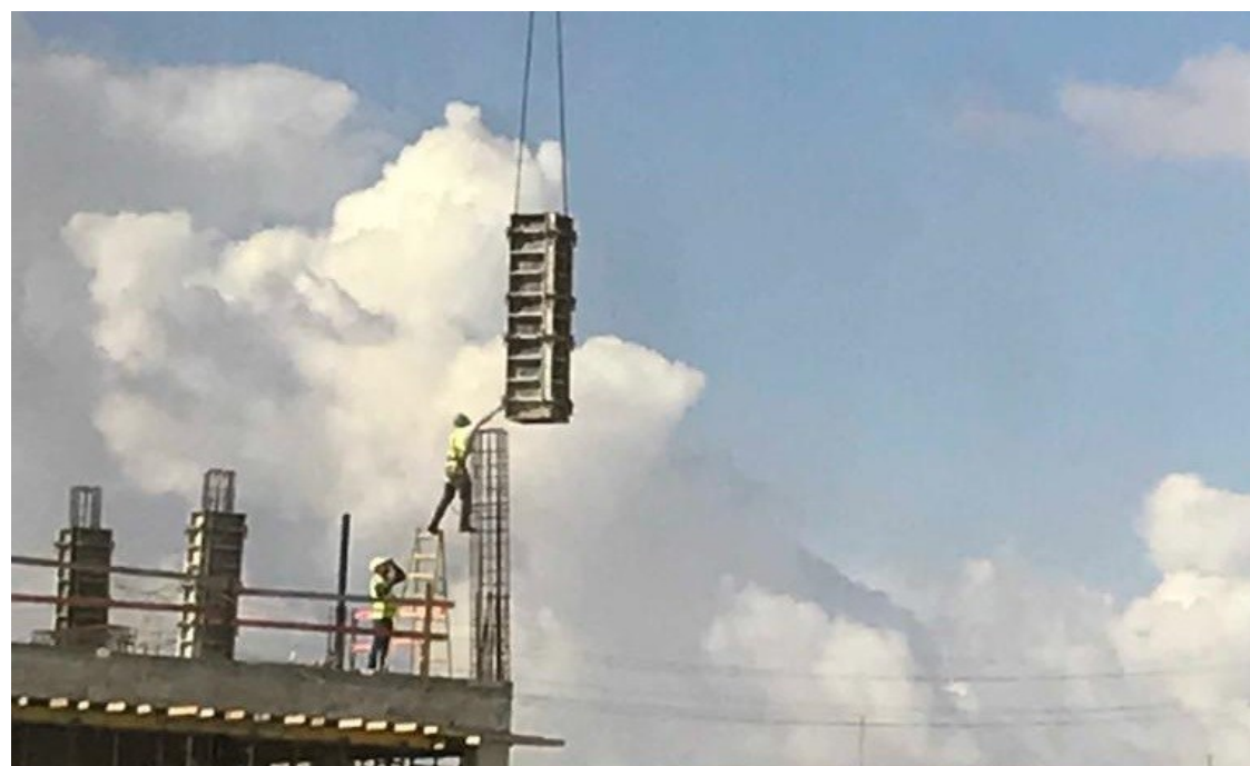
דו"ח – החברות המובילות בצווי בטיחות באתריהן בתחום בניין